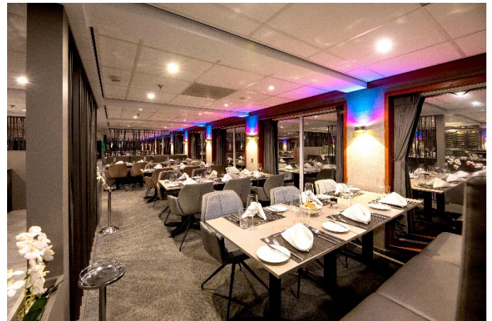
MS Nestroy, Restaurant