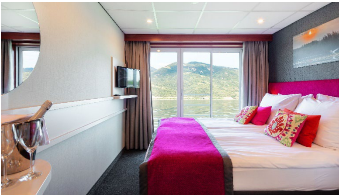
MS Nestroy, Doppelkabine Schiller- / Goethedeck