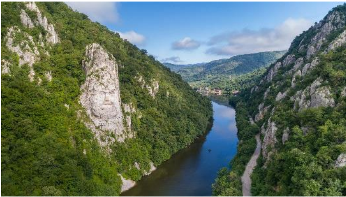
Eisernes Tor mit Decebal