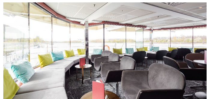
MS Nestroy, Panoramabar