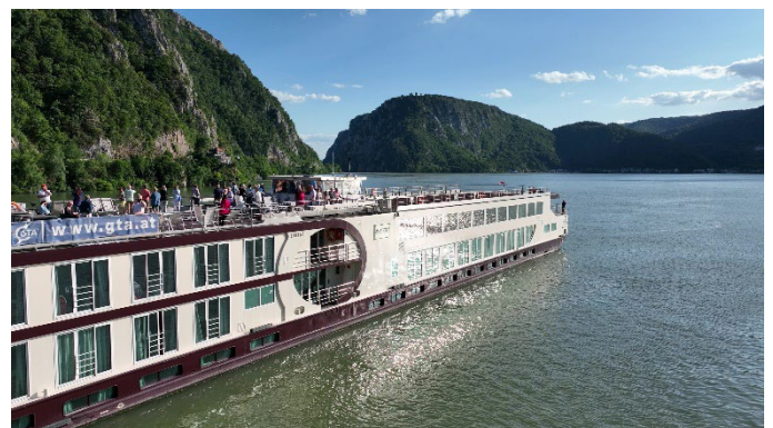
MS Nestroy im Eisernen Tor