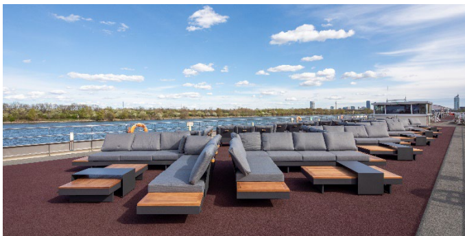
MS Nestroy, Lounge Sonnendeck