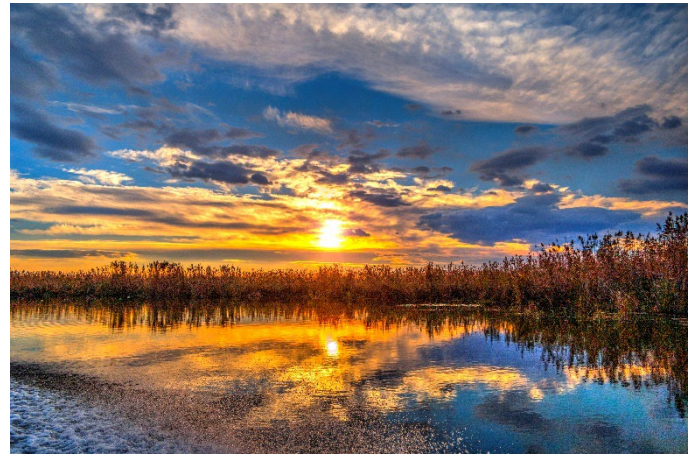
Donaudelta bei Sonnenuntergang