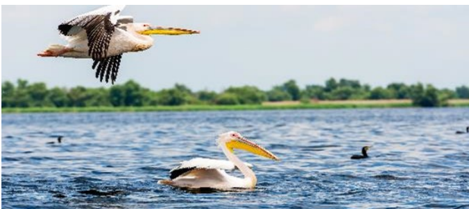
Pelikane im Donaudelta